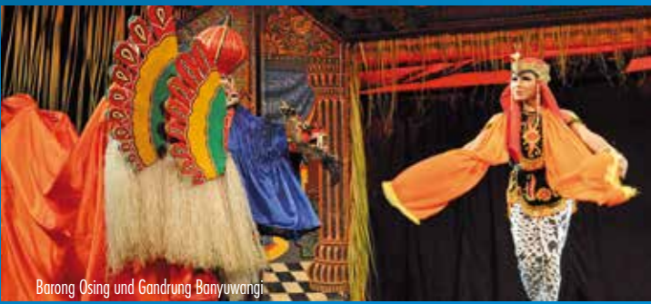
Barong Osing und Gandrung Banyuwangi